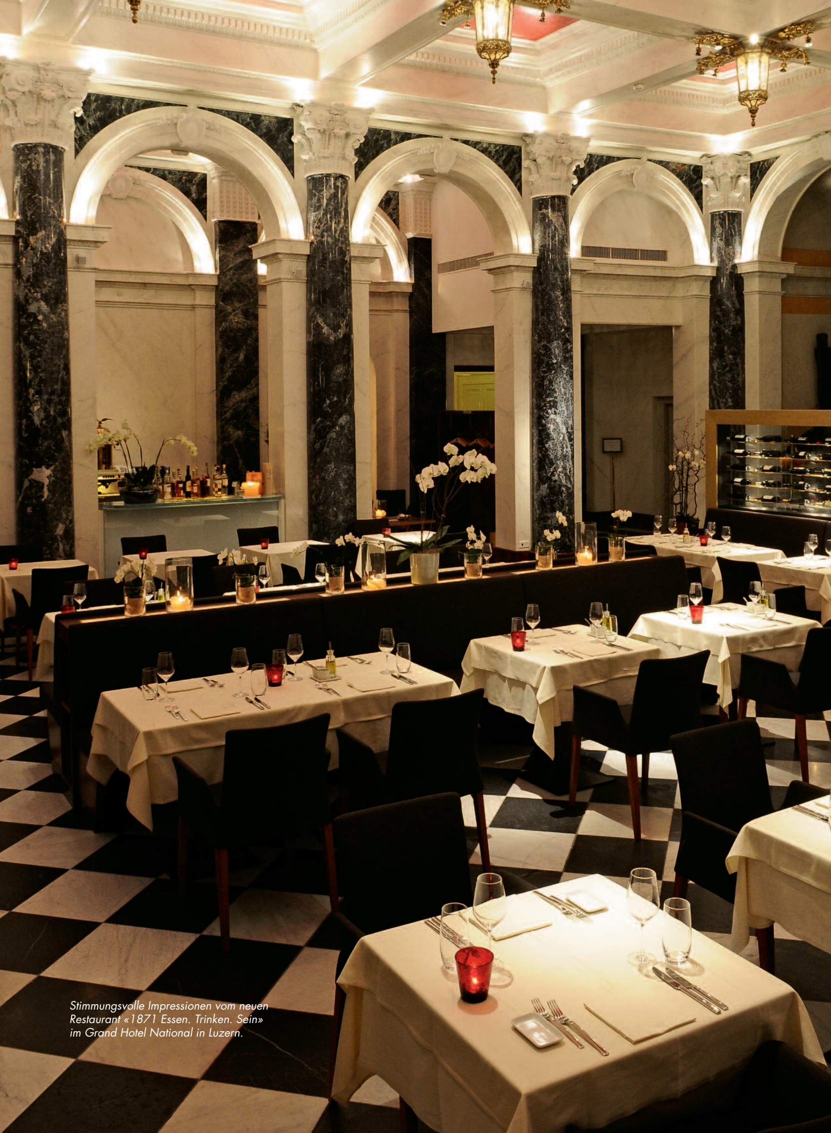
Stimmungsvolle Impressionen vom neuen Restaurant «1871 Essen. Trinken. Sein» im Grand Hotel National in Luzern.