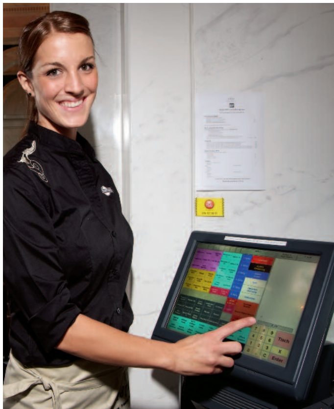
Die TOPOS-Touchscreen-Kassen draussen und im Innenbereich des Restaurants «1871» gestatten ein übersichtliches und speditives Handling bei Konsumationsbestellungen und beim Inkasso-Prozedere.

Maharadjas von Indien liessen sich von César Ritz und Auguste Escoffier verwöhnen. César Ritz wirkte von 1877 bis 1890 im Grand Hotel National.