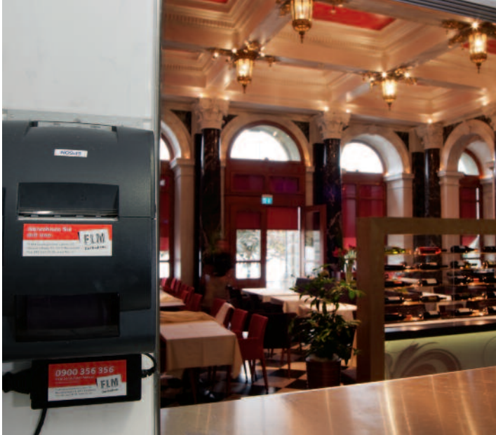
Die Küchendrucker in der Schau-Küche (mit Blick ins Restaurant «1871») und in der Produktionsküche im Untergeschoss sorgen für die schnelle Uebermittlung der Gäste-Orders, ohne dass dabei Missverständnisse und Reibungsverluste entstehen.