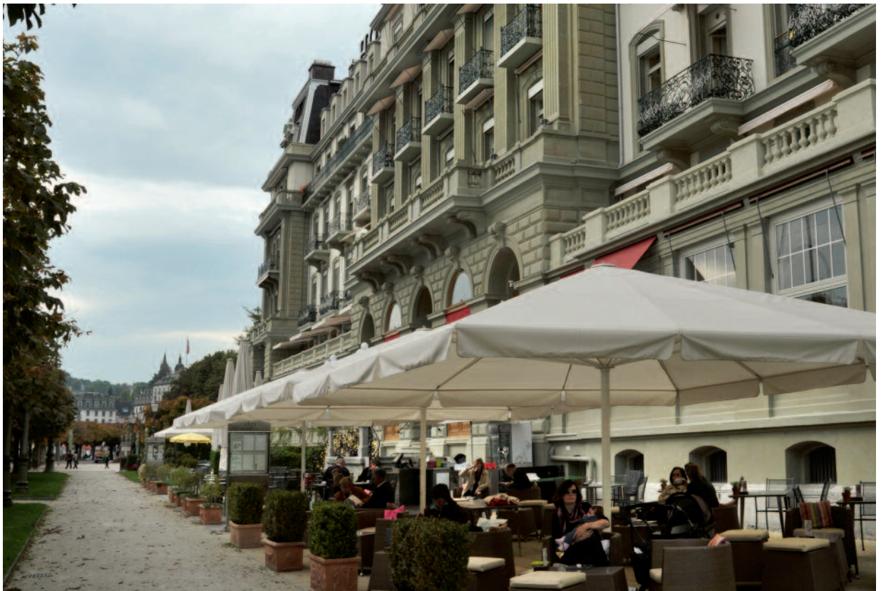
Der bald 140jährige Hotel-Palast des Grand Hotel National mit der Outdoor-Bar-Lounge des Restaurants «1871», das sich direkt an der Seepromenade von Luzern befindet.

«1871 Essen. Trinken. Sein.» im Grand Hotel National Luzern