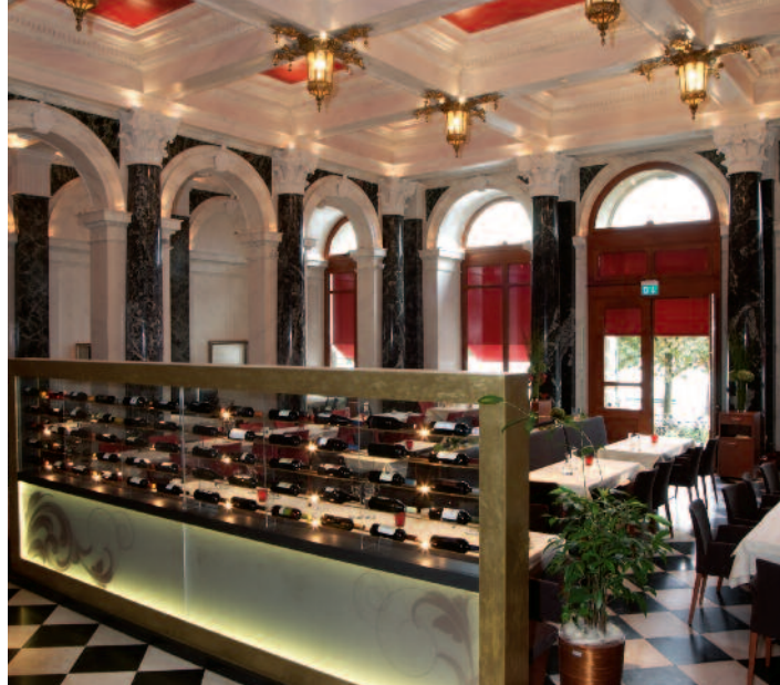
Blick in die ehemalige prächtige Hotellobby, in welcher jetzt das Restaurant «1871» betrieben wird, sowie auf die als Raumteiler wirkende moderne Vinothek.